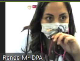
Renée M- DPA